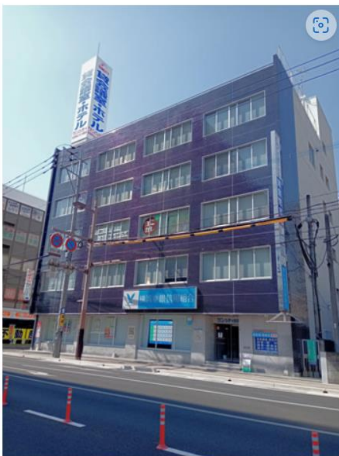
サンシティオフィスビル外観